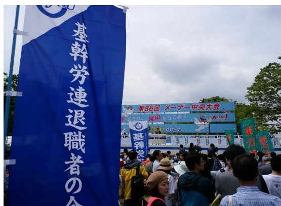
(各地のメーデーにシニアクラブメンバーが参加)

5月に開催した三役連絡会で、今年度の活動としてシニアクラブ地方ブロック懇談会を開催することを確認しました。テーマは、各県本部OB会との連携、政策実現行動の今後の展開に関する意見交換などです。すでに開催した東北以外で開催を予定しているブロックは、関東、東海、北陸、近畿、中国、四国、九州の6つで、開催時期は7月～8月下旬を予定しており、今後、早急に計画を具体化します。各県本部退職者の会役員および各県本部事務局長の皆様、よろしくご協力ください。