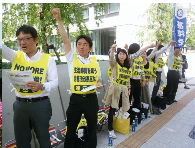
基幹労連現役メンバーのガンパロー！