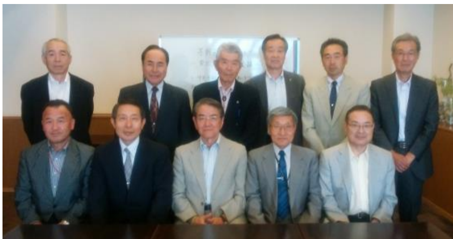
（東北ブロック懇談会に参加した各県 OB 会代表者）