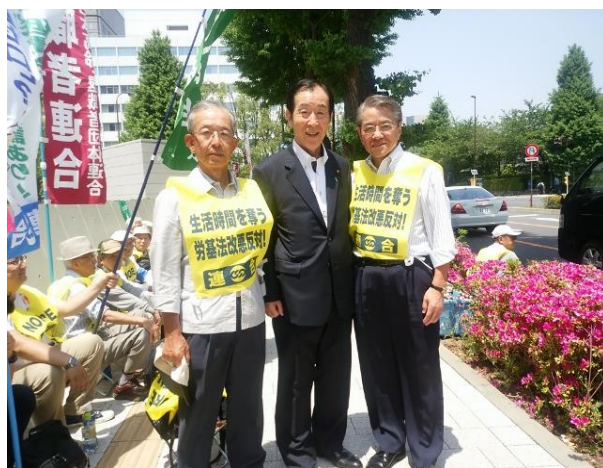
激励に駆け付けた高木義明議員と OB 会役員

また、5.27「STOP THE 格差社会！暮らしの底上げ実現」全国統一行動にも参加し、第189通常国会での労働者派遣法改悪法案、過労死促進法「高度プロフェッショナル制度」法案などに対峙する行動を展開しました。